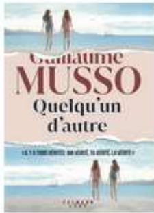
Quelqu'un d'autre GUILLAUME MUSSO