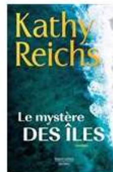
Le Mystère des îles KATHY REICHS