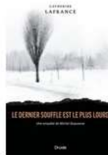
Le Dernier souffle est le plus lourd : une enquête de Michel Duquesne CATHERINE LAFRANCE