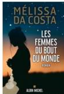
Les Femmes du bout du monde MÉLISSA DA COSTA